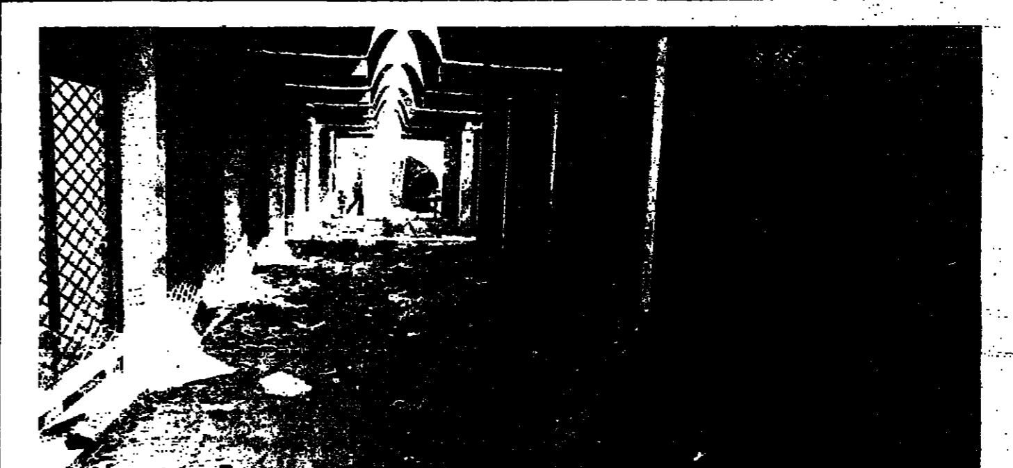
محاولة الحلات التجارية المارحة لصحة التعمير إلى مستودعات لرمي النفايات

وأجرت المادة 20، تطبيق الشريعة اللبنانية على كل لبناني أعلا كان أو محرماً أو متخلاً، قدم خارج الأرض اللبنانية على ارتكاب جريمة، أو جنحة تعاقب عليها الشريعة اللبنانية، في أي مكان من إقليمها.